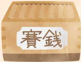
川尻神社にて 健康祈願